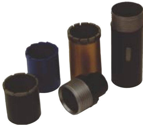
System mit Kernfangfeder