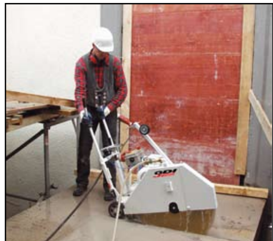
Für dieses Fugenschneidergerät empfehlen wir unsere Diamantscheiben vom Typ Nassschnitt AB100 oder AS 100 für Beton bzw. Asphaltarbeiten.

Alle Preise zzgl. der gesetzlichen MwSt.